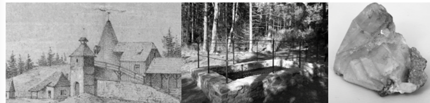
Modrý baryt.