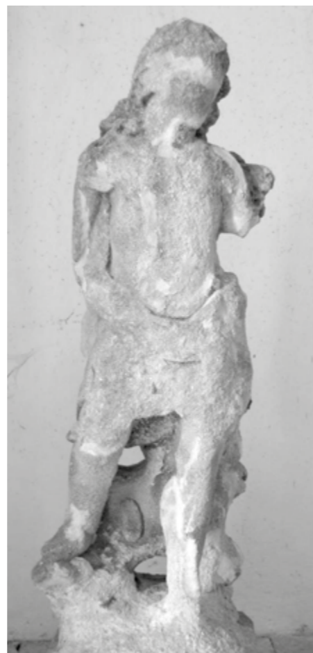
Druhý z andělíčků na historickém (nahoe) a současném snímku (dole)